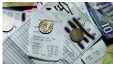
Saar voelt zich geïntimideerd en vermoed diefstal