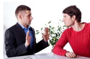
Theo ervaart agressie vanuit familie van cliënt